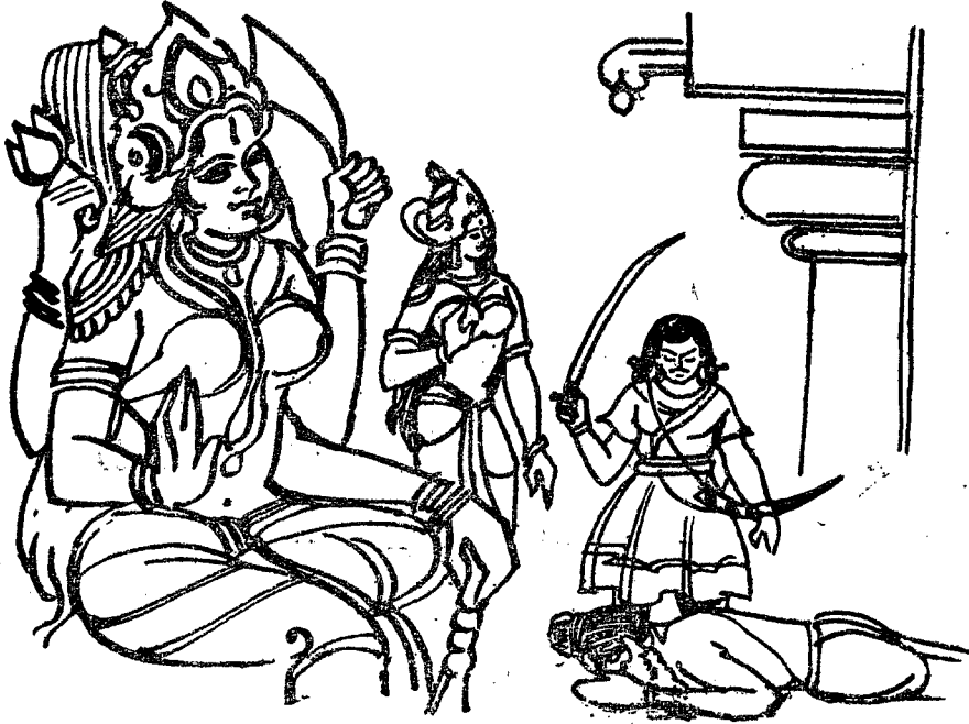
విక్రమాంకశిఖరి ముని శిరస్సు ఖండించుట మహాంకాళి ప్రత్యక్షమగుట

మాదిత్యునకు ప్రత్యక్షమై “పత్నా! నీ ధైర్యసాహసములకు మెచ్చుకొంటిని. నీకు కావలసిన వరములు కోరుకొనుము. యిచ్చెద”ననెను.