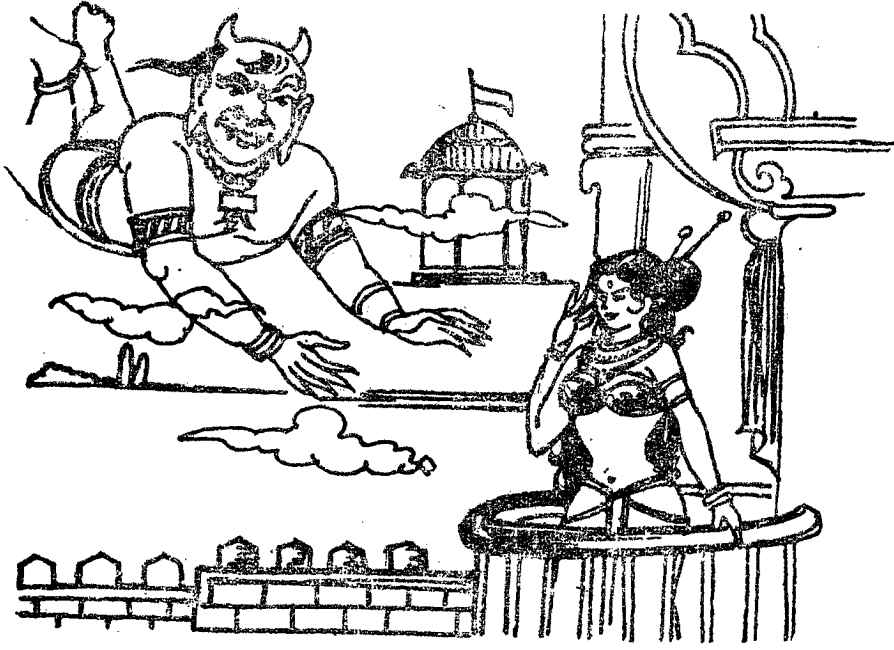
సద్గుణవతిని రాక్షసుడు ఎత్తుకొని పోవుట

రించి వారణపురం పగలంతయు ప్రేతరూపం చెంది, రాత్రివేళ బ్రతికియుండును. ప్రొద్దు పొడిచిన వెంటనే అందరు నిర్జీవులగుదురు.