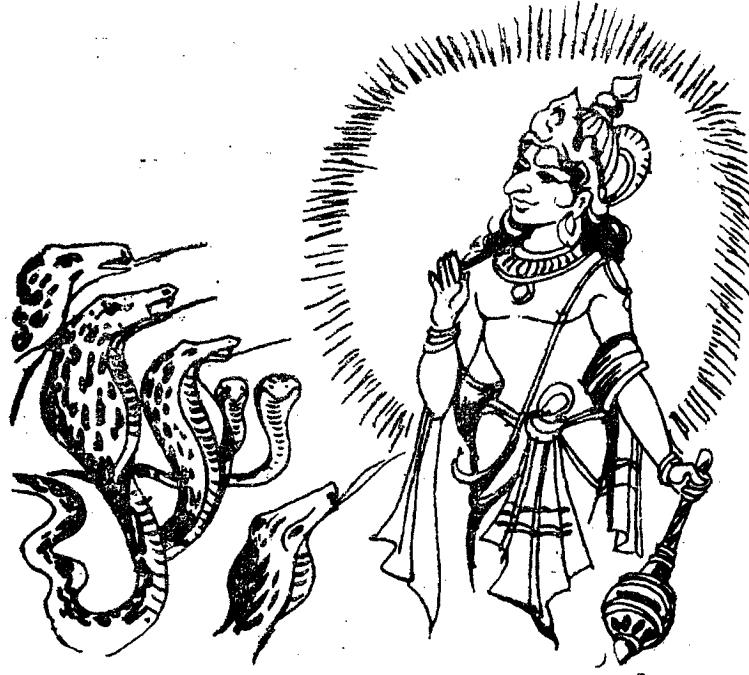
సర్పములు గరుత్మంతుని ప్రార్థించుట

వచ్చు వేళకు అన్ని పాములు ఒకచోట నిలబడి. “పక్షింద్రా! మాదొక చిన్న మనవి కలదు. దయయుంచి వినుము” అని ప్రార్థించినవి. “ఏమిటా మనవి చెప్పుడు” అని గరఃడుడు అడిగెను.