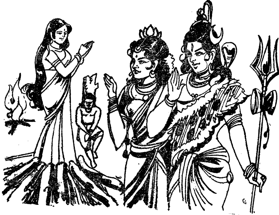
పార్వతీ పరమేశ్వరులు రత్నావతికి స్రత్యంకమై దొంగను బ్రతికించుట

పార్వతీ పరమేశ్వరులు అంతర్దానమైనంతట రత్నావతి తల్లిదండ్రులు కూతురును, చోరనాయకుని ఇంటికి దీసుకొనిపోయి ఎంతో వైభవముగా పెండ్లిచేసిరి.