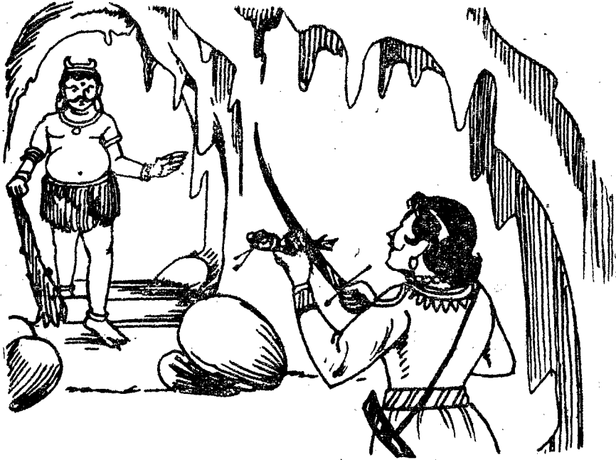
విక్రమాదిత్యుడు పురుగును పట్టితెచ్చిఖండించి రాక్షసుని చంపుట

పిమ్మట విక్రమాదిత్యుడు సద్గుణవతి యొద్దకుపోయి, జరిగిన విషయం లన్నియు చెప్పి, “రాక్షసుని చంపివేసితిని. ఇక మనం మీపట్టణంనకు నిరాటంక ముగా పోవచ్చును, రమ్ము” అని చెప్పెను.