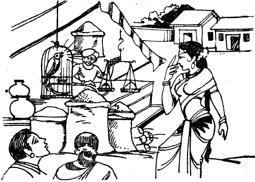
దుకాణమునందు ప.జరములోనున్న చిలుక నుందరి చెలికత్తెలు చూచి మాషించుట

గబగబ నుందరి వద్దకు వెళ్ళి చిలుక అన్నమాటలన్నీ చెప్పింది. ఆ మాటలువిన్న సుందరి ఆగ్రహం పట్టలేకపోయింది. “దానినెట్లయినను చంపి తినకున్న నాపేరు సుందరేకాదు” అద ప్రతిజ్ఞ చేసింది. వెంటనే ఆ చిలుకను పంపకున్న రాజుతో చెప్పి శిక్ష విధింపజేస్తాను. నిన్నుకూడ ఇకఘుండు నా గుమ్మం తొక్కనీయను. వెంటనే ఏ సంగతి తెలియజేయవలసిందని చెలికత్తెతో సోమసుందరశెట్టికి కబురు చేసింది.