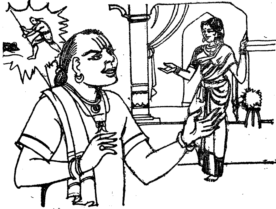
ఎలుకను చంపి భార్య వద్ద బసాయిలు చెప్పకొంటున్న వైశ్యుడు

వచ్చి, ఆమె దుఃఖమునకు కారణం తెలిసికొని, తనగృహమునకు రమ్మని పిలుచు కొని వెళ్ళి ఆమెకు కావలసిన పదార్థములనిచ్చి సంరక్షించుచుండెను.